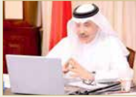
وزير العمل منحندا منتدى "البلاد"