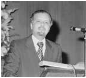
أحمد زكي يماني