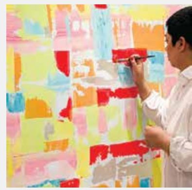
○ العلاج بالفن.