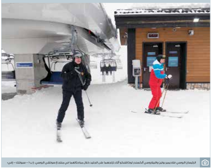
الرئيسان الروسي فلاديمير بوتين والبيلاوروسكي ألكسندر لوخاشينكو أثناء زيارتهما على الجبل خلال مباحثاتهما في منتجع سوتشكي الروسي، (أ ب أ - سبوتنك - أفي)

لهذا يقع على عاتق أولياء العهد في دولنا الخليجية مسؤولية الحفاظ على هذا الإرث وتعزيزه وعدم التقليل من شأنه أو إهماله أو تأخيرته نظراً للانحطاطات الكثيرة والمسؤوليات الجسيمة التي يحملونها أو بسبب الانشغال بالظروف المعقدة التي تمر بها المنطقة. ليكن إرث الآباء والأجداد رصيماً نبنى عليه ونضاعفه لا أن نتكل عليه فحسب في الظن أنه كافٍ، وحده لاستمرار تلك العلاقة بدأت القوة، فقد هدم الآباء والأجداد ما استطاعوا لتعزيز هذه الثقة المتبادلة وتلك العلاقة الوطيدة، والأل جاء دور الأبناء لينبؤوا هم رصيدهم الخاص في العلاقات الثنائية أو الثلاثية وما يزيد من تلاحمنا ويؤكد على وحدة مصيرنا المشترك.