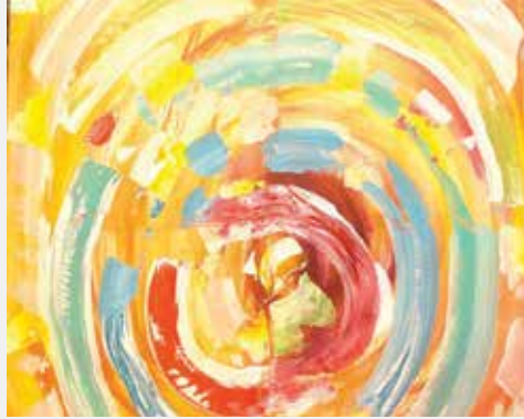
○ إحدى لوحاتها.