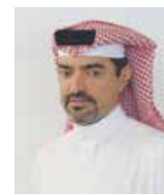
الشيخ محمد بن عبيد آل خليفة