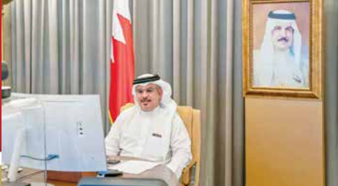
سمو ولي العهد رئيس الوزراء