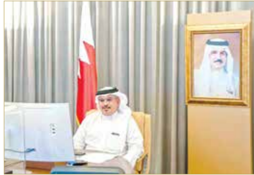
سمو ولي العهد رئيس الوزراء لدى لقائه المدير العام ورئيس التنفيذي للمعهد الدولي للدراسات الاستراتيجية

♦ سموولي العهد رئيس الوزراء: مد جسور التواصل وتقوية أسس الحوار