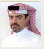
الشيخ عبدالله بن خالد