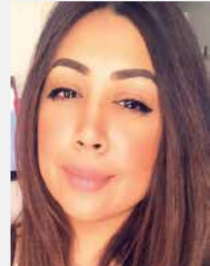
○ قبل المرض.