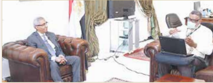
السفير جمهورية مصر في حوار مع الزميل سعيد محمد